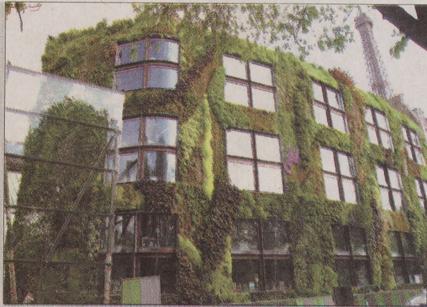
▲巴黎的布利碼頭博物館的外牆是布隆克享譽全球的代表作品。(布隆克提供)