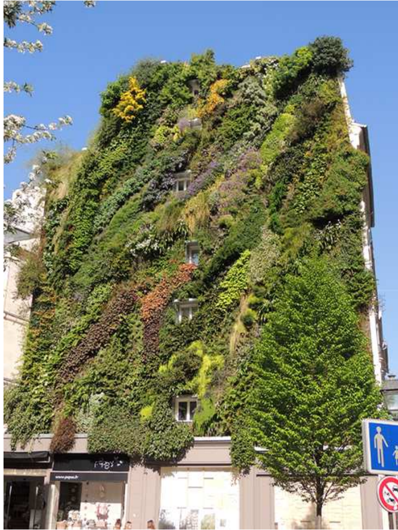
(צילום: Patrick Blanc)