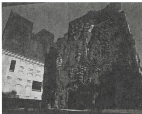
都市のオアシスとも呼べる壁面緑化