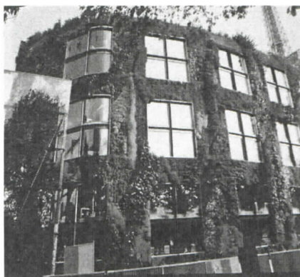
デザイン性に優れたビルの壁面緑化