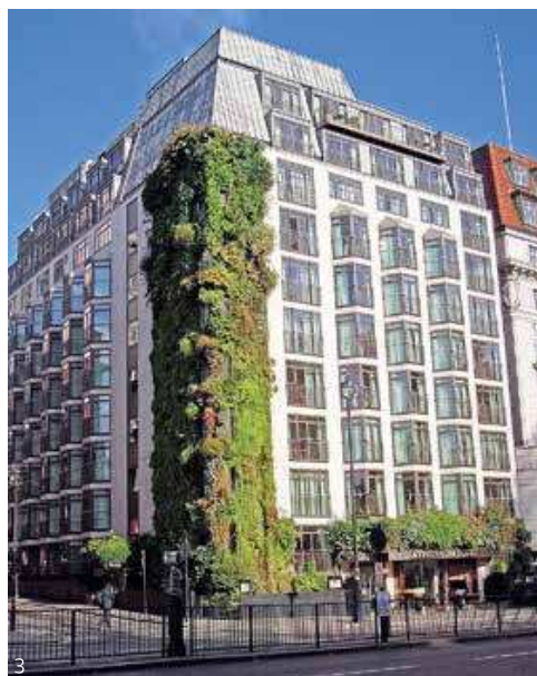
3- La façade de l'Athenaeum Hotel, à Londres. De nuit, le mur végétal est tout aussi présent, mis en valeur par l'éclairage.