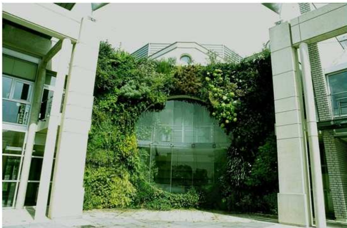
现代艺术博物馆正门