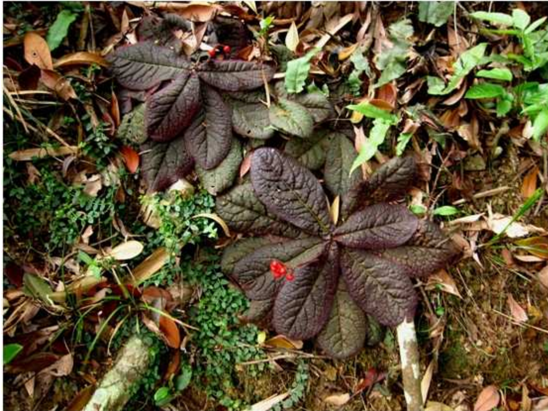
他发现并命名的植物 Begonia blancii

帕特里克在世界各地都积极搜寻适合绿墙使用的植被，在新加坡他还发现了一个新的植物种类，那种植物的叶子颜色漆黑，却以他的姓氏Blanc（法语白色之义）命名，他说这真的太好笑了。他说：“山林是天然的垂直花园，这就是为什么我不喜欢单一的植物绿化，因为在自然界里没有什么是单一的，总是很多不同种类的植物占领不同地形空间，彼此交融……在热带原始森林里，我发现许多植物都是根本不需要土壤的。”确实，在马来西亚雨林的8000多种植物里，有2500余种都是气生和附生植物。大自然本身的多样和富有，为他的垂直花园创作提供了无限灵感。每到一地，他最先想了解当地的植物种类和习性，以及用于垂直花园的可能性。就在大会第二天，分论坛本来有他的圆桌讨论，结果到处找不到人，原来他跑去爬山，把会议中心东边和西边的山都给爬了，回来激动地跟主办方说：“我发现 了2、30种植物都可以用在绿墙上面哦！”作为植物学家，他对会场绿化的布置不大满意：“你们看，会场的小盆栽是非洲植物，大盆栽是巴西树种，杭州这样一个物种丰富的地方，绿化为什么不用本地植物呢？”他希望明年再来的时候，可以带来完全用江南植物布置的绿墙。