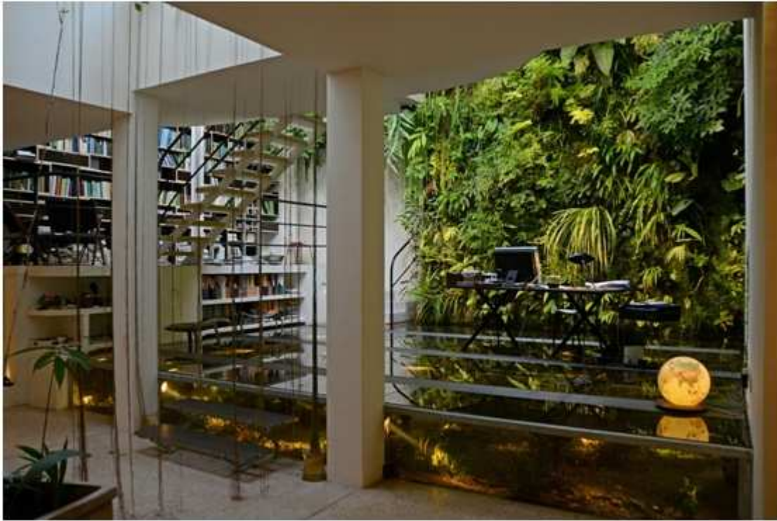
家里的书房 地板下是水族箱

！) 并表示：“很多人认为绿墙的潮气对书本不好，30年过去了，我可以跟你说，一点也没问题，一点没问题！”