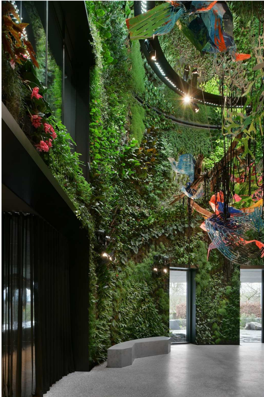
Patrick Blanc a réalisé un impressionnant mur végétal au cœur du bâtiment.

En plus des espaces de travail en open spaces et des quelques bureaux fermés, le programme prévoit trois salons d'invités au rez-de-chaussée et un salon VIP à l'étage, une salle de jeu et une salle à manger pour les employés. On y trouve également un auditorium pour 120 personnes, ainsi que pas moins de quatre cuisines de tailles différentes. Ceci s'explique par le grand intérêt que porte Creutz & Partners à la gastronomie et qui se