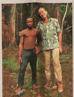
▲在喀麥隆的喀比(Krabi)，Patrick Blanc與當地的婦人與男子合照。