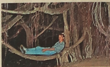
▲他經常深入森林觀賞不同植物，圖為1984年他身在泰國。

其一是，他小時候養魚，而黃缸裏放了植物作過濾之用。他想到今這些植物爬出玻璃缸，然後漸漸長到牆上去。令家裏看起來更漂亮。其二是他在19歲的時候深入泰國森林開闢，自此就與植物為伍。夢裏夢外都是綠色的，像他整個人，由1985年開始染綠髮，有逾30年時間，他穿戴綠色的腰帶、皮帶、鞋子、指環和項