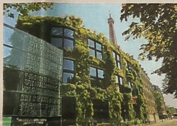
▲座落在巴黎市中心的蓋布朗利博物館(Quai Branly Museum)的外牆由Patrick Blanc設計。(受訪者官網圖片)

去過山頂，還去過大帽山。「你們有很多美麗的野生動物。」他也有去太子妃遊藝場資料。