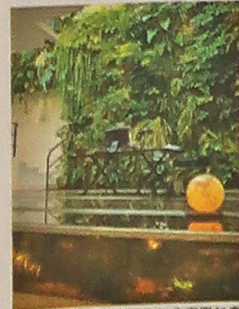
▲Patrick Blanc家裏的工作室猶如森林，巨型魚缸化身成地板。