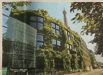
▲座落於巴黎市中心的蓋布朗利博物館(Quai Branly Museum)的外牆由Patrick Blanc設計。