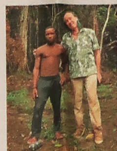
▲在喀麥隆的喀比(Krabi)，Patrick Blanc與當地的喀比人與男子合照。