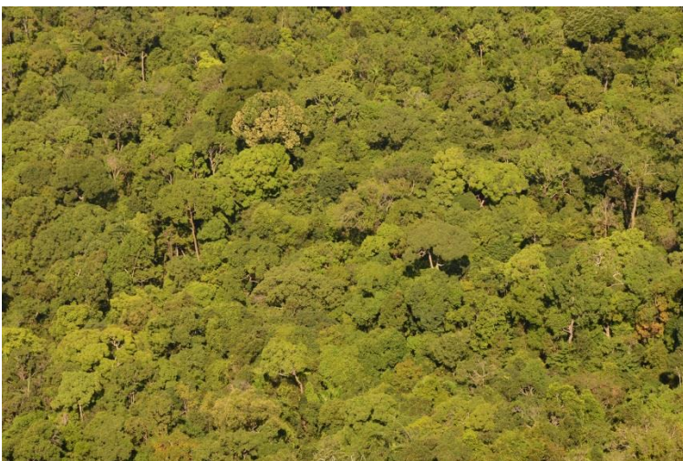
Timidité inter-couronnes (cimes) et intra-couronnes (cimettes), dans la canopée, Langkawi, Malaisie