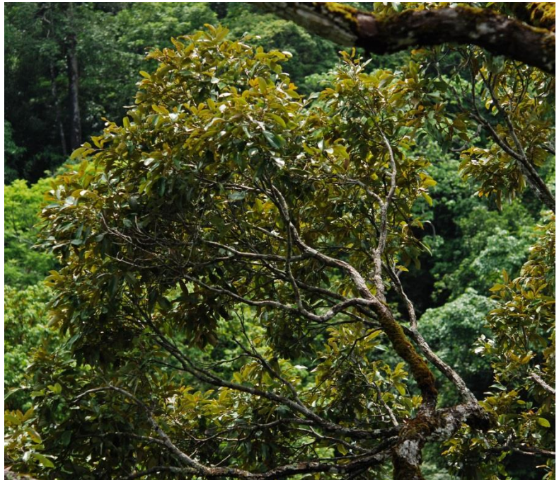
Individualisation progressive et descendante des rameaux puis des branches à l'intérieur d'une cimette, Hinboun, Laos