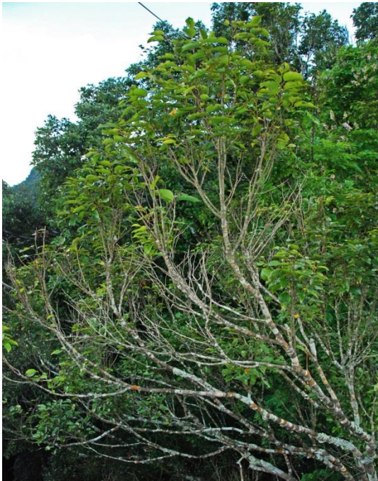
Nécroses descendantes des pousses à l'intérieur d'une cimette, Hinboun, Laos