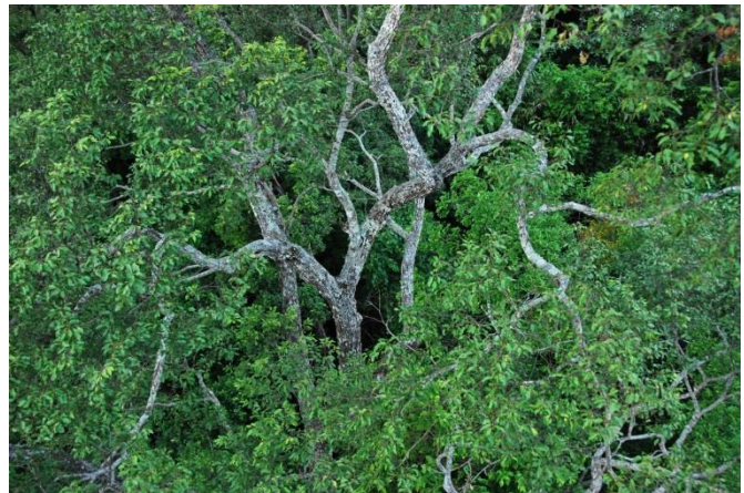
Bifurcations des branches maîtresses à l'intérieur d'une couronne, Hinboun, Laos