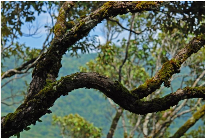
Bifurcations progressives des branches à l'intérieur d'une couronne, Hinboun, Laos