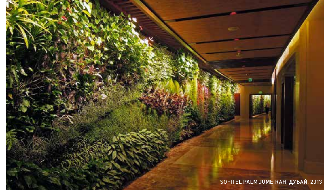
SOFITEL PALM JUMEIRAH, ДУБАЙ, 2013

“Ла Нувель Тауэрс” (Le Nouvel Towers) – это совместный с архитектором Жаном Нувелем (Jean Nouvel) проект. Лианы 243 видов покрывают башни высотой 200 м. В этом проекте очень большое разнообразие флоры, характерной для больших высот. Во многих других своих работах я использую меньше 10 видов. Таким образом, “Ла Нувель Тауэрс” – это настоящий ботанический сад, возможно, первый в мире, полностью приспособленный для вьющихся растений.