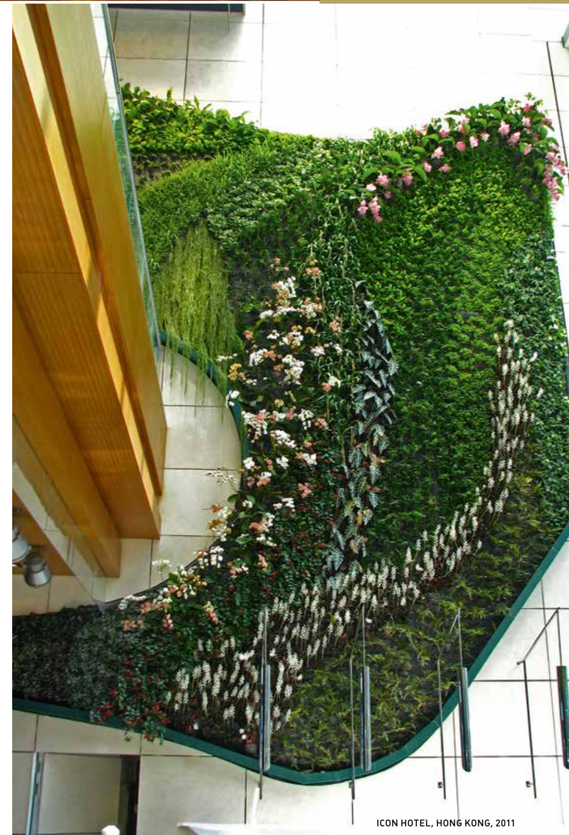
ICON HOTEL, HONG KONG, 2011