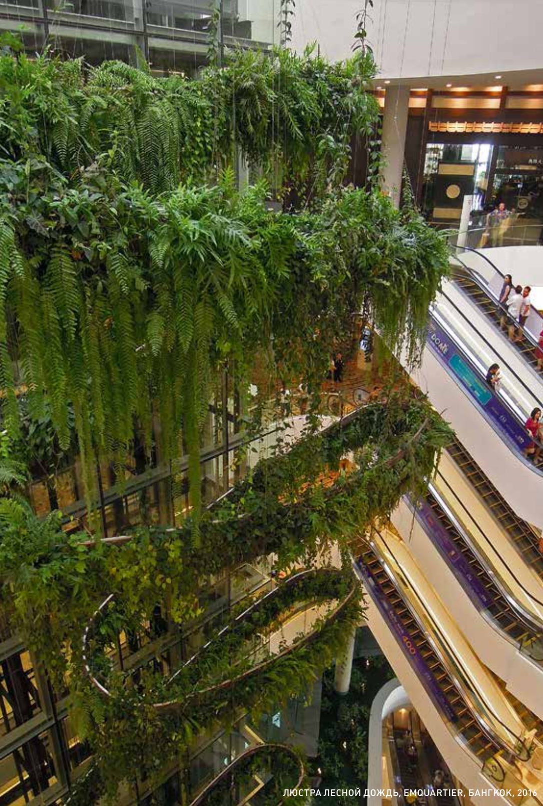
ЛЮСТРА ЛЕСНОЙ ДОЖДЬ, ЕМОУАТИЕР, БАНГКОК, 2016

“ В работе над вертикальными садами самое главное – наличие познаний в ботанике. Это необходимо для того, чтобы выбрать подходящие растения и правильно их расположить. ”