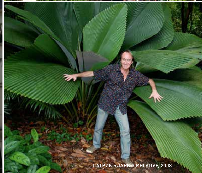
ПАТРИК БЛАНК, СИНГАПУР, 2008

“ Создать вертикальный сад у себя дома вполне реально! Именно это я сделал около 40 лет назад! Потребуются синтетический войлок, ПВХ и помпа. А если правильно выбрать растения, проблем с уходом не возникнет. ”