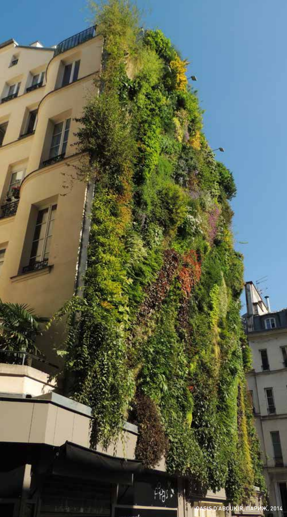
ОАИС Д'АВОУКИР, ПАРИЖ, 2014